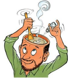
Ill.: "Håndbog om individuel kompetencevurdering i AMU" – UVM 2008

Vejledningsnetværkene består af udbydere af voksen efteruddannelse i lokalområdet, som sammen skal være med til at sikre, at flere borgere kommer i gang med uddannelse og opkvalificering for at imødekomme det voksende behov for kvalificeret arbejdskraft i området.